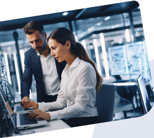
Image générée par Midjourney, avec la consigne, ou « prompt » : « man and woman in white and bright a data center, confidently managing data on a computer, symbolizing the challenges and opportunities of data migration. »