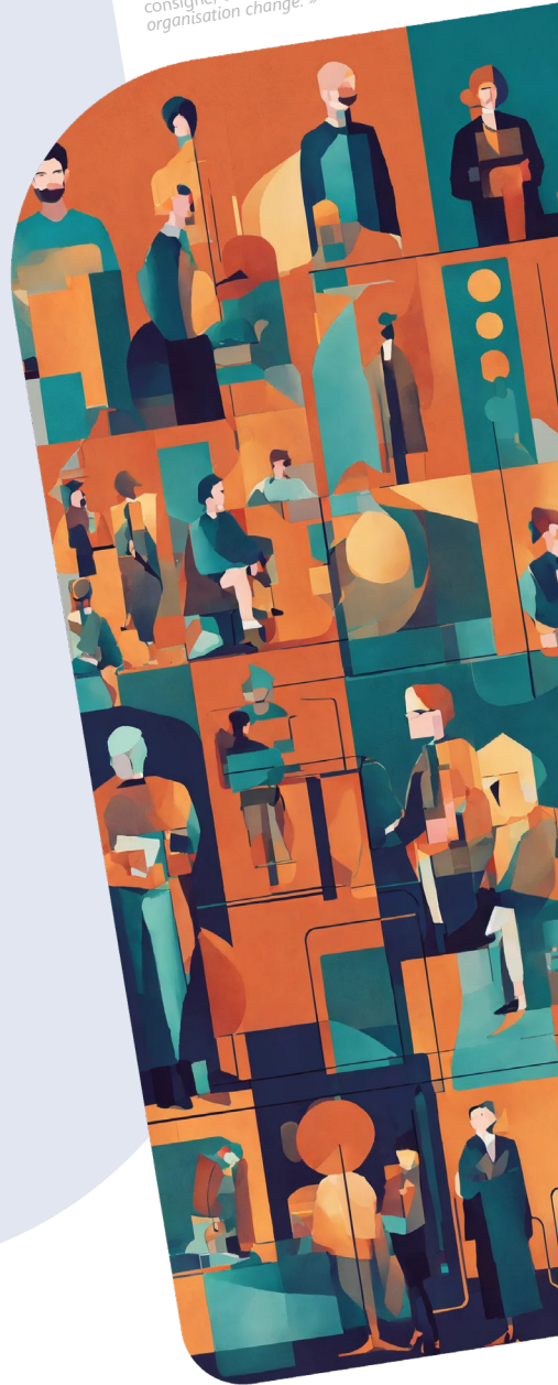
Image générée par Lexica Art 3.5, avec la consigne, ou « prompt » : « Illustration of organisation change. »

Article écrit par des humains augmentés de Chat-GPT 4 et Google Bard