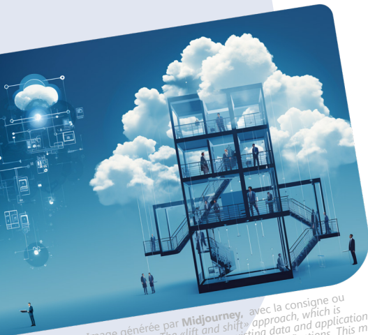
Image générée par Midjourney, avec la consigne ou « prompt » : « The «lift and shift» approach, which is characterized by transferring existing data and applications to a new cloud platform without major modifications. This method allows for quick migration and reduces operational disruptions, as current business processes remain unchanged. »

En fin de compte, il n'y a pas de stratégie de migration universelle. Chaque entreprise doit évaluer ses besoins et ses objectifs pour déterminer la meilleure approche. Quelle que soit la stratégie choisie, la collaboration étroite entre les équipes techniques et métier est essentielle pour assurer le succès de la migration vers des plateformes modernes.