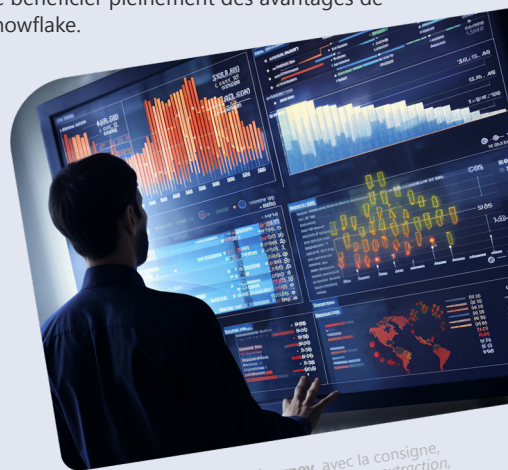
Image générée par Midjourney, avec la consigne, ou « prompt » : « The analysis, planning, extraction, and preparation of data shown in a software user interface. »

Le processus de migration vers Data Cloud de Snowflake comprend donc l'analyse, la planification, l'extraction et la préparation des données, le chargement dans la plateforme, les tests, le déploiement et la documentation . Chacune de ces étapes est cruciale pour garantir le succès de la migration et pour permettre aux entreprises de bénéficier pleinement des avantages de Snowflake.